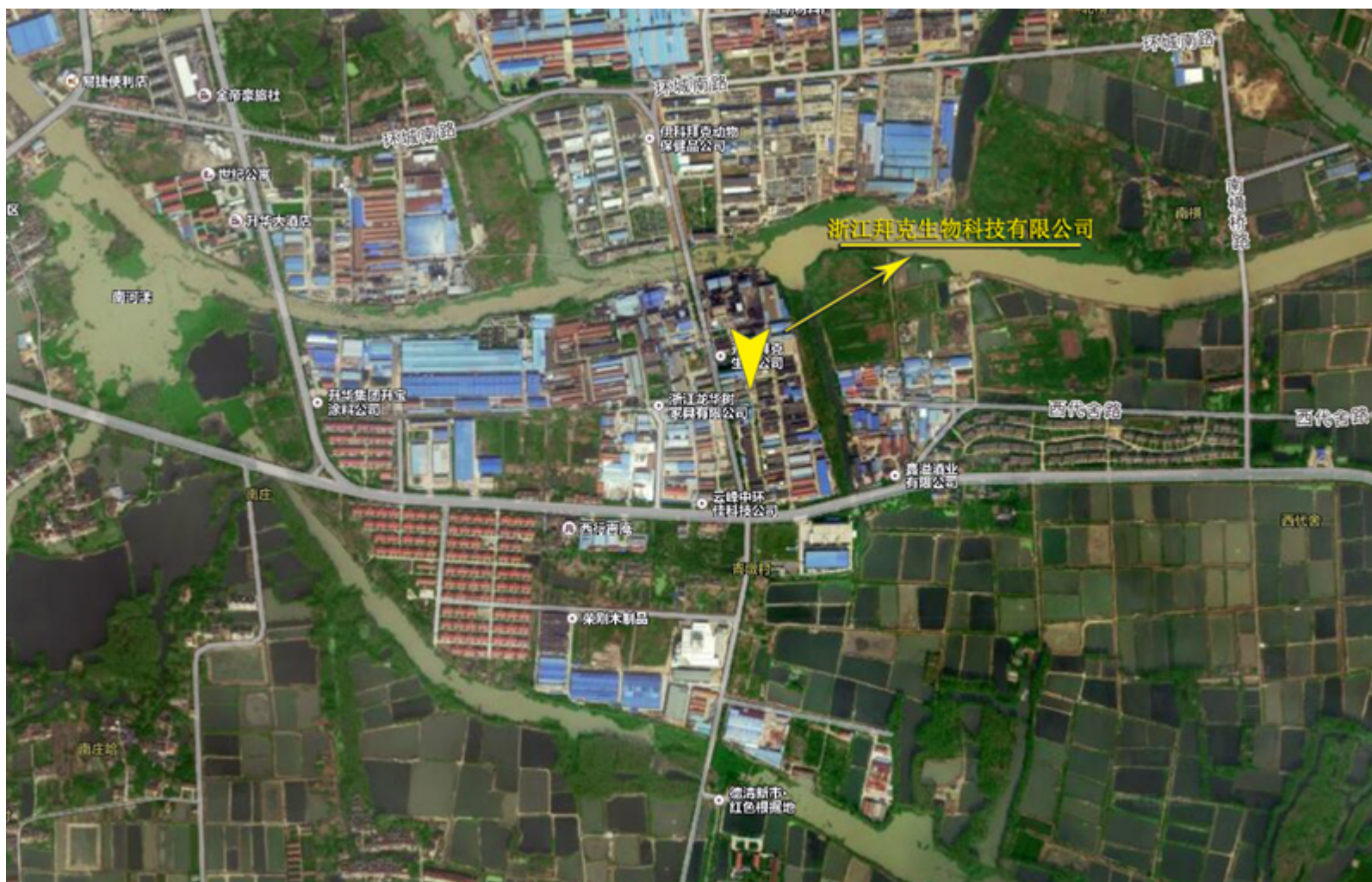
附图 1 项目地理位置图